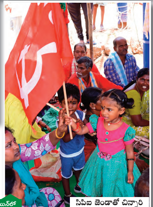
సిపిఐ జెండాతో చిన్నారు

కేంద్ర ప్రభుత్వం పెంచిన పెట్రోల్ డీజిల్, గ్యాస్ ధరలను వెంటనే తగ్గించాలని, రాష్ట్ర ప్రభుత్వం ప్రజలకు ఇచ్చిన వాగ్దానాలను తక్షణమే అమలు చేయాలని సిపిఐ ఆధ్వర్యంలో బుధవారం ఉమ్మడి నల్లగొండ జిల్లా వ్యాప్తంగా కలెక్టరేట్లు ఎదుట భారీ ధర్మాలు.