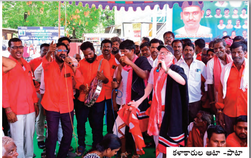
కళాకారుల ఆటా -పాటా