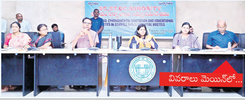
వివరాలు మెయిన్ లో...