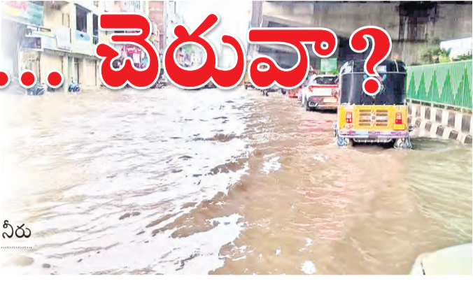
ప్రజాపక్షం / హైదరాబాద్

హైదరాబాద్ నగరంలో శనివారం భారీ వర్షం కురిసింది. లోతట్టు ప్రాంతాలు జలమయమయ్యాయి. నగరంలోని పలు ప్రాంతాల్లో కుండపోత వర్షం కురవడంతో రహదారులు జలమయమై ట్రాఫిక్కు తీవ్ర అంతరాయం ఏర్పడింది. ఇదే సమయంలో మేడ్చల్ జిల్లా మల్టాజీగిరి పరిధిలోని టెలికాం కాలనీలో విద్యుత్ తీగ తెగిపడడంతో తండ్రికూతుళ్ళు మృతి చెందిన విషాద ఘటన చోటుచేసుకుంది. హైదరాబాద్లో పాటు రంగారెడ్డి, మేడ్చల్ జిల్లాల్లో సైతం వాతావరణం మేఘావృతమైంది. వర్షా ప్రభావిత వాతావరణ పరిస్థితులు శంషాబాద్ విమానాశ్రయంపైనా పడ్డాయి. పలు విమానాల రాకపోకలకు అంతరాయం కలిగింది. వాతావరణం అనుకులించకపోవడంతో విమానాలను దారిమళ్ళించారు. ఢిల్లీ నుంచి హైదరాబాద్కు రావాల్సిన ముఖ్యమంత్రి రేపంతో రెడ్డి ప్రయాణిస్తున్న విమానాన్ని కూడా బెంగళూరుకు తరలించారు. శనివారం మధ్యాహ్నం తరువాయి 8లో