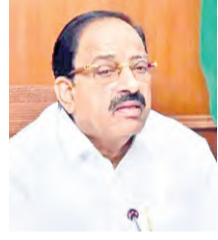
ప్రజాపక్షం / హైదరాబాద్

ఆయన నివాసంలో పలు వివరాలు సేకరించిన సిబ్ అధికారులు