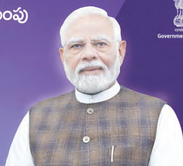
Government of Bharat