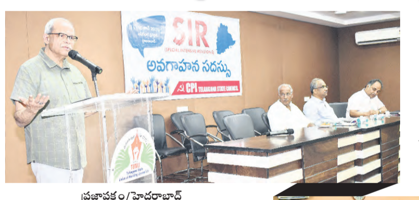
ప్రజాపక్షం / హైదరాబాద్