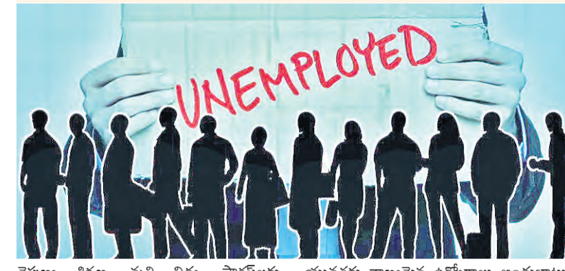
నైపుణ్య శిక్షణ, వృత్తి విద్య, స్టెబిలైజర్లు ప్రోత్సాహం, యువతకు స్థిరమైన, గౌరవప్రదమైన ఉపాధి అవకాశాల కల్పనపై దృష్టి పెట్టాలి.

ప్రపంచవ్యాప్తంగా నిరుద్యోగత యువత భవిష్యత్తుకు పెద్ద సవాలుగా మారతోంది.