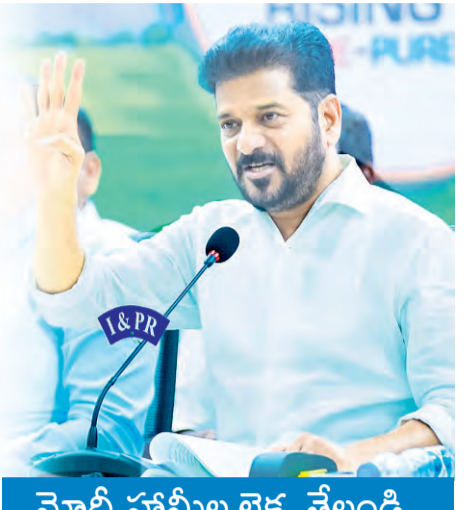
మోదీ హామీల లెక్క తేల్చండి..

కెసిఆర్, కెటిఆర్, మంత్రి కిషన్ రెడ్డి కలిసి హైదరాబాద్ మెట్రో ఫేజ్-2పై కుట్రలు ● మొదటి దశను రాష్ట్ర ప్రభుత్వం స్వాధీనం చేసుకోకుండా అడ్డుపడుతున్నారు ● ప్రభుత్వ గ్యారంటీ ఇచ్చినప్పటికీ కిషన్ రెడ్డి అడ్డుకోవడం వల్లే అవకాశం రుణాలు ఎల్ అండ్ టీకీ విడుదల కావడంలేదు ● పార్లమెంట్ ఎన్నికల్లో బిజెపికి కెసిఆర్ ఆంధ్రప్రదేశ్ సహకరించినందుకు ఇప్పుడు గురుదక్షిణ చెల్లిస్తున్నారు ● మీడియా సమావేశంలో ముఖ్యమంత్రి రేవంత్ రెడ్డి ఆగ్రహం ● కేంద్రం ఎన్ఐసి ఇస్తే మందశాతం ప్రభుత్వ ఈక్వైటీతో మెట్రో రైల్ రెండో దశ విస్తరణకు సిద్ధమని వెల్లడి