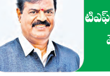
21న 'దీవానీ' సినిమా అవార్డుల వేడుక