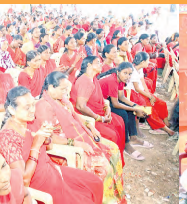
తిరుగుబాటు తప్పదు అనే సందర్భంగా