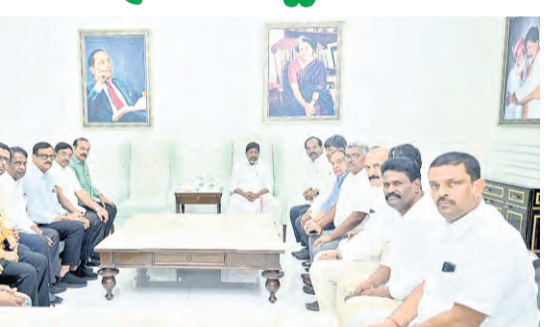
ఉపముఖ్యమంత్రి భట్టి విక్రమార్క