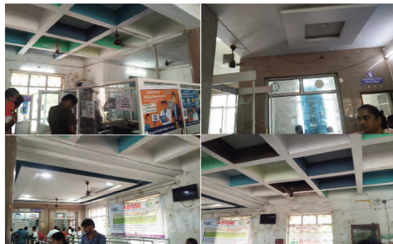
ప్రజాపక్షం/ఖమ్మం : ఖమ్మం జిల్లా ప్రభుత్వ ప్రధాన ఆస్పత్రిలో కనీస సదుపాయాల లేమి రోగులను తీవ్ర ఇబ్బందులకు గురిచేస్తోంది.

-తిరగని ఫ్యాన్లు -తాగునీటి సదుపాయం అంతంతమాత్రమే.. -ఇబ్బందులు పడుతున్న రోగులు, బంధువులు -పట్టించుకోని సంబంధిత అధికారులు