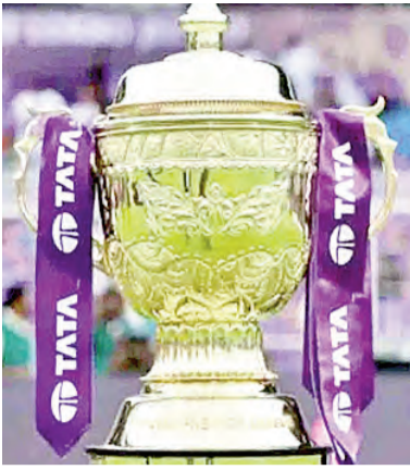
అయితే.. మే రెండో వారం టోర్నీ సమయంలో వర్షాలు వరుగుతున్నాయి. ముందుకు వాసల కారణం బోర్డికి అంతరాయం కలుగుతోంది. అలానే ఎండ తీవ్రతకు అటామెంట్లు, అభిమానులు తీవ్ర ఇబ్బందులు పడుతున్నారు. కాబట్టి ఈ ఆంశాన్ని దృష్టిలో ఉంచుకొని బిసినెస్, ఐపిఎల్ కార్యనిర్వాహణ మండలి కీలక ఆలోచన చేస్తోంది. ఐపిఎల్ 2027ను మార్చి నెలపాటున కాకుండా ముందుగానే జరపాలని భావిస్తున్నారు. మార్చి 10 నుంచి మార్చి 15 మధ్య సీజన్ ఆరంభించే అవకాశముంది' అని దేవజిత సెక్రటరీ వెల్లడించారు. అంతేకాదు షెడ్యూల్ ముందుకు జరిపాలని అభిమానులు నుంచి అభ్యర్థనలు వస్తున్నాయి. డా.జోషి, మే 15 కల్లా టోర్నీని ముగించాలని భావిస్తున్నట్లు బిసినెస్ కార్యదర్శి పేర్కొన్నారు. నాలుగు రాష్ట్రాల ఆసెంబ్లీ ఎన్నికల కారణంగా ఐపిఎల్ 19వ సీజన్ కాస్త ఆలస్యమైన విషయం తెలిసింది.

ఐపిఎల్ క్రీడా విస్తారం వచ్చే ఇండియన్ ప్రీమియర్ లీగ్ విషయంలో భారత్ క్రికెట్ నియంత్రణ మండలి కీలక నిర్ణయానికి సిద్ధమవుతోంది. ప్రతి సీజన్ మూడు నెలల పాటు ప్రారంభించే బిసినెస్.. 2027 ఎడిషన్ విషయంలో ముందు చూపుతో వ్యవహరించాలనుకుంటోంది. సీజన్ మధ్యలో ముందు దిండలు, ఆకాల వర్షాలతో తలెత్తుతున్న ఇబ్బందులకు చెక్ పెట్టాలనే ఉద్దేశంతో ఐపిఎల్ 2027ను కాస్త ముందుగానే జరపాలని భావిస్తోంది. ఈ విషయమే ఐపిఎల్ పచ్చే సీజన్ షెడ్యూల్ పై గురువారం బిసినెస్ సెక్షన్ దేవజిత సెక్రటరీ హెంరీ జోషికి తెలిపారు. ఇండియన్ ప్రీమియర్ లీగ్ 2027ను ముందుగానే మొదలెట్టాల్సి బిసినెస్ భావిస్తోంది. సెక్రటరీ దేవజిత సెక్రటరీ జాడీ ఆంశంపై మాట్లాడుతూ.. 'ఈ విషయం ఐపిఎల్ మార్చి 29(28)వ తేదీన ప్రారంభమైంది.