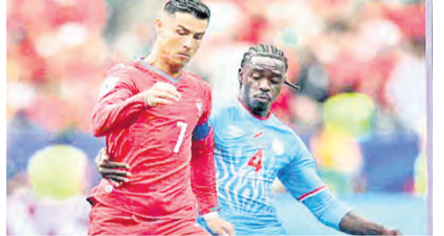
పోర్చుగల్ ప్లేయర్ క్రిస్టియనో రోనాల్డో.

లిగ్ ఫైనల్ కేవలం 2026 గ్రాండ్ ఫైనల్ మ్యూచ్లో బలమైన పోర్చుగల్ లు జట్టుకు ఉపయోగపడే పాత్ర వహించింది. టెక్నాస్ట్రోని హయాస్టన్ వేదికగా డిఆర్ కాంగోతో జరిగిన ఈ మ్యూచ్ 1-1 తో డ్రాగా ముగిసింది. వరల్డ్ కప్ లో కాంగో జట్టుకు ఇది మొట్టమొదటి పాయింట్ కావడం విశేషం. మ్యూచ్ ప్రారంభమైన 6 నిమిషాలలోనే పోర్చుగల్ యువ ఆటగాడు జోవాన్ నెవెస్ పెడ్రో నెటో అందించిన అద్భుతమైన ట్రాన్స్ఫర్ హెడ్ గ్యాస్ గోల్ గా మంచి పోర్చుగల్ కు 1-0 అధిక్యాన్ని అందించాడు. అయితే తొలి సగం ముగిసి సమయానికి కాంగో ఆటగాడు యోవాన్ విస్సా లభించిన అవకాశాన్ని చక్కగా ఉపయోగించుకుని హెడ్ గ్యాస్ గోల్ చేసి సగం సమయం 1-1 తో సమం చేశాడు. దీంతో వరల్డ్ కప్ చరిత్రలో కాంగోకి తొలి గోల్ సమయం అయ్యింది. ఇక తన కెరీర్ లో రికార్డు స్థాయిలో 6వ వరల్డ్ కప్ అడుక్కున్న పోర్చుగల్ స్ట్రైకర్ క్రిస్టియనో రోనాల్డో ఈ మ్యూచ్ తీవ్రంగా నిరాశపరిచాడు. రోనాల్డో ఈ మ్యూచ్ లో కేవలం 29 టాటల్ మాట్లాడు సాధించాడు. అతని వరల్డ్ కప్ కెరీర్ లోనే ఒక మ్యూచ్ లో అత్యంత తక్కువగా ఇన్స్ట్రక్ట్ అయిన సందర్భాలలో ఇది ఒకటి. మ్యూచ్ సెకండ్ హాఫ్ లో రోనాల్డో రెండు సులువైన గోల్స్ చేసి అవకాశాలు వచ్చినప్పటికీ, వాటిని అతడు గోల్ గా మలచలేకపోయాడు. కాంగో డిఫెన్స్ అతడిని విజయవంతంగా కట్టడి చేసింది. ఇక పోర్చుగల్ జట్టు తదుపరి మ్యూచ్ లో ఉత్తేజాన్ని తలపడదు.