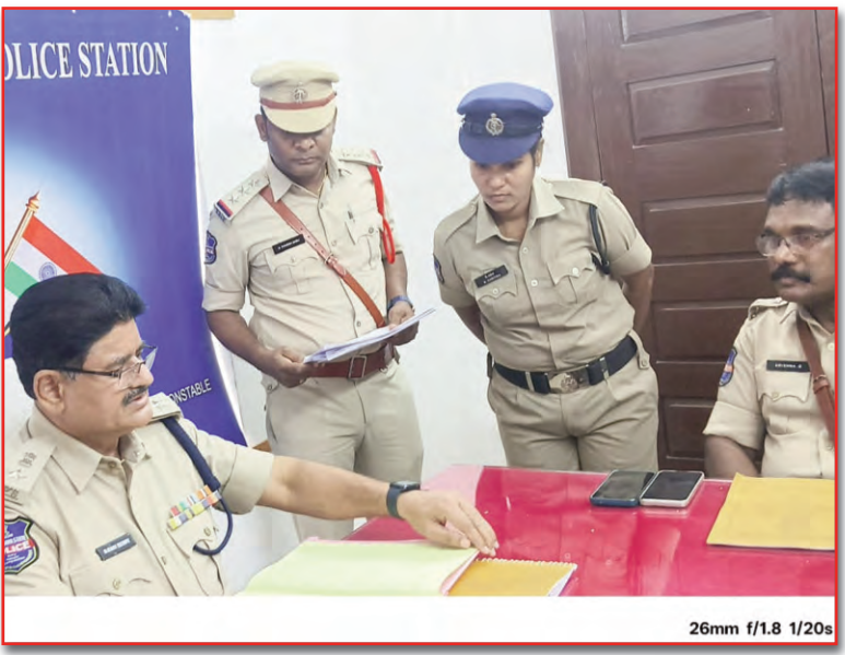
26mm f/1.8 1/20s