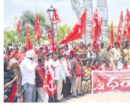
● హనుమకొండ కలెక్టరేట్ ఎదుట సిపిఐ, సిపిఐ(ఎం) ఆందోళన