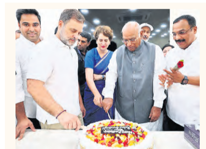
పుట్టినరోజు సందర్భంగా ఢిల్లీలోని ఎఐసీసీ కార్యాలయంలో కేకే కడవేసిన ప్రతిపక్షనేత రావలలిగాంధీ

రాష్ట్ర ప్రభుత్వం ప్రతిష్ఠాత్మకంగా చేపట్టిన మూసీ రివరీఫ్రంట్ అభివృద్ధి ప్రాజెక్టుకు కీలక ముందడుగు పడింది. మూసీ పునరుద్ధరణ కార్యక్రమంలో భాగంగా బాహుభూల్ పద్ధతిని నిర్వహించున్న గాంధీ సరోవర్ ప్రాజెక్టుకు కేంద్ర రక్షణ మంత్రిత్వ శాఖ అధికారిక అనుమతులు మంజూరు చేసింది. ఈ మేరకు రూ.533.42 కోట్ల విలువైన 83.81 ఎకరాల రక్షణాభివృద్ధి భూమిని ప్రాజెక్టు అభివృద్ధి కోసం వినియోగించుకునేందుకు వర్గించి పర్మిట్ జారీ చేసింది. గోల్కొండ ఆర్మిలరీ సెంటర్ పరిధిలోని భూమిలో అభివృద్ధి పనులకు కేంద్రం అనుమతులు ఇవ్వడంతో గాంధీ సరోవర్ ప్రాజెక్టు అమలు దిశగా అడుగులు వేగవంతం కానున్నాయి. అయితే, వినియోగానికి ఇచ్చిన భూమికి ప్రతిగా ఆదే విలువ కలిగిన భూమిని