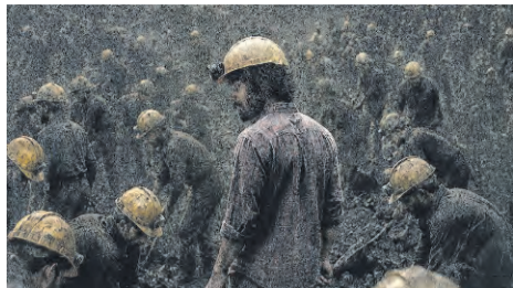
బొగ్గ గమీల నేపథ్యంలో ఎన్ ఎన్ 6

భారతీయ సినిమాకు ఎన్నో కొత్త ప్రయోగాలు పరిచడం చేశారు. ఇప్పటికీ ఎలా సాధ్యమవుతున్నాయి ? సింగితం : అప్పుడు. కేవలం వర్ష వర్షాలే సాధారణం. 'మాయాబజార్', 'పెళ్లినాటి ప్రమాణాలు', 'శ్రీకృష్ణార్జున యుద్ధం' వంటి చిత్రాల కథా చర్చల్లో పాల్గొనేటప్పుడు ఎప్పుడూ కొత్తగా ఏదైనా చేయాలనే ఆలోచన ఉండేది. అందుకే ప్రతి సినిమాలో కొత్త ప్రయోగం చేయాలనే తపన ఉండేది. 'మాయాబజార్' కాలం నుంచే ఆ ఆలోచనా విధానం నాలో పెరిగింది. కొత్తదనం కోసం వెతకడం, ప్రేక్షకులకు ఎప్పుడూ చూడని అనుభూతిని ఇవ్వడం నా సినీ ప్రయాణంలో ముఖ్యమైన భాగంగా మారింది. కేవలం ఒక ప్రయోగం మాత్రమే కాదు, చాలా కాలంగా నా మనసులో ఉన్న కల. సినీమోషన్ ప్రతి సందర్భం బయట నటీనటులే పాడుతూ చెప్పే చిత్రాన్ని రూపొందించాలని ఎన్నో విధాలుగా కోరుకున్నాను. ఈ ఆలోచనలో ఉన్న కొత్తదనం నన్ను ఆసక్తి పెంచాయి. దాదాపు 40 ఏళ్ల క్రితమే ఈ కల కన్నాను. అయితే దాన్ని సాకారం చేసిన ముఖతే మార్తూరి నాగ్ అన్నీనడే. ప్రశ్న : మి కెరీర్లో మీకు అనిపించినట్లుగా తగిన గుర్తింపు పొందని సినిమా ఏదైనా ఉందా ? సింగితం : నిజానికి నేను తీసిన ప్రతి సినిమా నాకు ఇష్టమే. నేను నమ్మని సినిమా ఎప్పుడూ తీయలేదు. అయితే కొన్ని సందర్భాల్లో ప్రేక్షకులు నా ఆలోచనతో ఏకీభవించలేదు. ఉదాహరణకు నా తొలి చిత్రం 'సీతలి జాయింటి'. ఆ చిత్రాన్ని మేధావులు ఎంతో ప్రశంసించారు. విమర్శకులు, మీడియా, పత్రికలు ప్రశంసల వర్షం కురిపించాయి. కానీ బాక్సాఫీస్ వద్ద మాత్రం అది పెద్ద పరాజయం పొందింది. ప్రేక్షకులు అంగీకరించకపోతే మిగతా ప్రశంసలన్నీ వృధా అవుతాయని