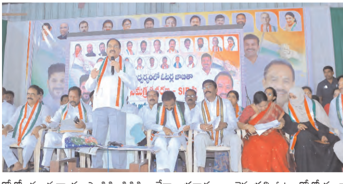
కోల్పోయారన్నారు. ఎబిసి, పిసి ఆదేశాల ప్రకారం లైన ప్రతి ఓటు కోల్పోకుండా చూడాలన్నారు. ఖమ్మం