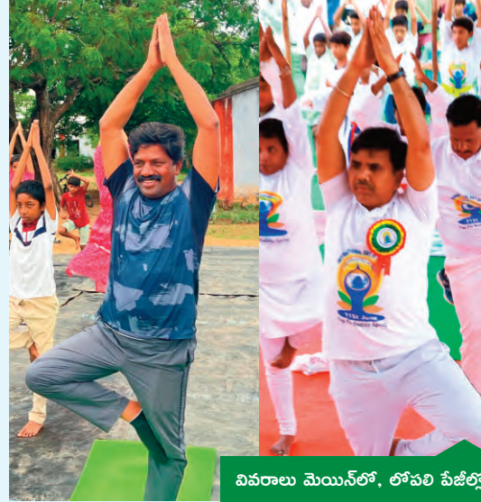
వివరాలు మొయిన్లో, లోపలి పేజీల్లో

నకిరేకల్ వివిఎం పాఠశాలలో ప్రభుత్వ విప్ వేముల వీరేశం యోగా నల్లగొండ మేకల అభినవ్ స్టేడియంలో కలెక్టర్ యోగాసనాలు