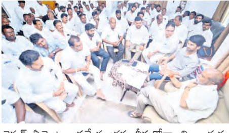
అందోల్ ఏజెంట్ల ప్రత్యేక శ్రద్ధ తీసుకోవాలని సూచించారు. ఓటర్ జాబితాలో ఉన్న తప్పింపులను గుర్తించి సవరణలు చేపట్టేందుకు కృషి చేయాలని, అర్జులైన ఓటరు కూడా జాబితా నమోది నిర్వహించాలని, ఈ సందర్భంగా మంత్రి మాట్లాడుతూ అర్జులైన ప్రతి ఒక్క పౌరుడు ఓటరుగా నమోదు అయ్యేలా బూత్

సర్పై బూత్ లెవెల్ ఏజెంట్లతో మంత్రి దామోదర్ రాజనర్సింహ సమావేశం ప్రజాపక్షం / సంగారెడ్డి : స్పెషల్ ఇంటిన్స్పెక్టివ్ రివిజన్ పై బూత్ లెవెల్ ఏజెంట్లతో రాష్ట్ర వైద్య ఆరోగ్యశాఖ మంత్రి దామోదర్ రాజనర్సింహ సమావేశం నిర్వహించారు. అందోల్ నియోజవ కర్ణంలో జరగుతున్న స్పెషల్ ఇంటిన్స్పెక్టివ్ రివిజన్ కార్యక్రమంపై అందోల్, పట్టణ, పుల్లెల చౌల కూరు మండలాలకు చెందిన బూత్ లెవెల్ ఏజెంట్లతో మంత్రి దామోదర్ రాజనర్సింహ సంగారెడ్డిలోని జన నివాసంలో అవగాహన సమావేశం నిర్వహించారు. ఈ సందర్భంగా మంత్రి మాట్లాడుతూ అర్జులైన ప్రతి ఒక్క పౌరుడు ఓటరుగా నమోదు అయ్యేలా బూత్