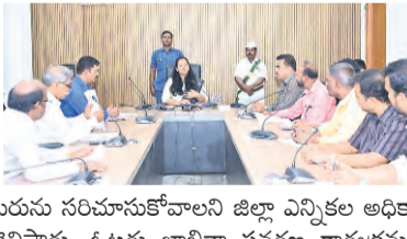
జిల్లాలో అర్జులైన పౌరులందరూ ఈ ప్రత్యేక సమగ్ర సవరణ (సర్) కార్యక్రమంలో భాగస్వామ్యం చేయాలని, ఓటరు జాబితాలో తమ పేరును సరిచూసుకోవాలని జిల్లా ఎన్నికల అధికారి, కలెక్టర్ ప్రతిమా సింగ్ తెలిపారు. ఓటరు జాబితా సవరణ కార్యక్రమంపై గుర్తింపు పొందిన రాజీవుల పార్టీలతో సమావేశం నిర్వహించారు. ఈ సందర్భంగా జిల్లా కలెక్టర్ మాట్లాడుతూ తప్పకుండా ఓటరు జాబితా రూపొందించేందుకు అందరూ సహకారాలను సూచించారు. స్పెషల్ ఇంటిన్స్పెక్టివ్ రివిజన్ కార్యక్రమం 25 నుండి జూలై 24 వరకు జరుగుతుందని తెలిపారు. గుర్తింపు పొందిన రాజీవుల పార్టీలు ప్రతి పోలింగ్ బూత్ కేంద్రానికి ఒక బూత్ ప్రతినిధిని నియమించి వివరాలు అందించాలని, ఓటరు జాబ

కలెక్టర్ ప్రతిమా సింగ్ ప్రజాపక్షం/మెదక్ : జిల్లాలో అర్జులైన పౌరులందరూ ఈ ప్రత్యేక సమగ్ర సవరణ (సర్) కార్యక్రమంలో భాగస్వామ్యం చేయాలని, ఓటరు జాబితాలో తమ పేరును సరిచూసుకోవాలని జిల్లా ఎన్నికల అధికారి, కలెక్టర్ ప్రతిమా సింగ్ తెలిపారు. ఓటరు జాబితా సవరణ కార్యక్రమంపై గుర్తింపు పొందిన రాజీవుల పార్టీలతో సమావేశం నిర్వహించారు. ఈ సందర్భంగా జిల్లా కలెక్టర్ మాట్లాడుతూ తప్పకుండా ఓటరు జాబితా రూపొందించేందుకు అందరూ సహకారాలను సూచించారు. స్పెషల్ ఇంటిన్స్పెక్టివ్ రివిజన్ కార్యక్రమం 25 నుండి జూలై 24 వరకు జరుగుతుందని తెలిపారు. గుర్తింపు పొందిన రాజీవుల పార్టీలు ప్రతి పోలింగ్ బూత్ కేంద్రానికి ఒక బూత్ ప్రతినిధిని నియమించి వివరాలు అందించాలని, ఓటరు జాబితాలో పేరు చేర్చడం, తొలగించడం, సవరణలు చేయడం వంటి సేవలను https://voters.eci.gov.in వెబ్ సైట్ ద్వారా లేదా ఆన్లైన్లో కూడా చేసుకోవచ్చని తెలిపారు. అలాగే ఓటరు హెల్ప్ లైన్ యాప్ ద్వారా కూడా దరఖాస్తులు చేసుకోవచ్చన్నారు.