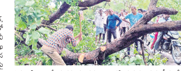
తీన్న ప్రాంతాల్లో మరమ్మతు పనులు కొనసాగుతున్నందున బీర్పంద, దర్గాజీపేట్ వైపు గల 33 కేవీ బంపర్ ను నిలిపివేసి జిన్నారం మండలం నుండి 33 కేవీ ఫీడ్ ద్వారా ఇతర సబ్ స్టేషన్లకు ప్రత్యామ్నాయంగా విద్యుత్ సరఫరా పునరుద్ధరించడం జరిగిందని, ఆయా మండలాలలో గల పలు గ్రామాలకు విద్యుత్ సరఫరాను త్వరితగతిన పునరుద్ధరించేందుకు అధికారులు సిబ్బంది చేసివస్తున్నారు ఎజ తెలిపారు.

చెట్ల కొమ్ములు, కర్రలు స్తంభాలు విరిగి పలు మండలాలకు విద్యుత్ అంతరాయం ప్రజాపక్షం / ఖానాపూర్ : ఖానాపూర్ నియోజవ కర్ణంలో ఖానాపూర్, పెంటి, కడం మండలాలలో సోమవారం మధ్యాహ్నం ఉదయం అంతరాయం కూడిన భారీ వర్షం కురిసింది. ఈ వర్షం కాటకంగా కడం, పెంటి 33 కేవీ ఫీడ్లలో విద్యుత్ అంతరాయం ఏర్పడిందని ఖానాపూర్ విద్యుత్ శాఖ ఏఈ రామ్ సింగ్ తెలిపారు. ఖానాపూర్ కడం మండలాల గ్రామాలైన బీర్పంద, దర్గాజీపేట్ అటవీ ప్రాంతాల్లో బెజూరి చెట్లు విద్యుత్ లైన్లపై కూలిపోవడంతో కడక్కుర్ల తెగిపోయి ఫీడ్లు డెబ్బుతిన్నాయని, దీంతో పలు ప్రాంతాలలో విద్యుత్ సరఫరా నిలిచిపోయిందన్నారు. ఈ సమాచారం తెలుసుకున్న విద్యుత్ అధికారులు సిబ్బందితో కలిసి సంఘటన స్థలానికి చేరుకుని విరిగిన చెట్లు, స్తంభాల పునరుద్ధరణ చర్యలు చేపట్టారు. రహదారిపై అతరం చెల్ల కామ్ములు, తెగిన విద్యుత్ తీగలను తొలగించి ట్రాఫిక్ కేసు అంతరాయం కలగకుండా చర్యలు తీసుకున్నామని, విద్యుత్ డెబ్బు