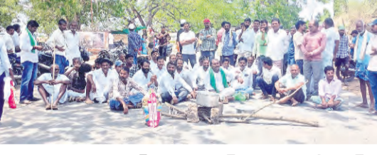
ప్రజాపక్షం / ఖానాపూర్ : ఖానాపూర్ మండల మాన్యూవర్ల గ్రామ రైతులు సోమవారం ఖానాపూర్ నుండి మెట్లపల్లి వెళ్లే ప్రధాన రహదారిపై ధర్నా నిర్వహించారు. వారు మాట్లాడుతూ తాము అమ్మిన పప్పు కింజింటులకు 10 కోట్ల రైన్ మిల్లర్లు కట్ చేయడం జరిగిందని, ఆ కట్

చేసిన డబ్బులు ఎవరి ఖాతాలోకి వెళ్తున్నాయో తెలపాలని డిమాండ్ చేశారు. 10 కోట్ల కట్ చేయడం ఏంటని ప్రశ్నిస్తూ, పప్పు కింజింటులకు రాష్ట్ర ప్రభుత్వం డబ్బులు చెల్లించాలని రైతు సంఘం ఆధ్వర్యంలో పెద్ద ఎత్తున ధర్నా నిర్వహించారు. ధాన్యం అమ్మి రెండు నెలలు గడుస్తున్నా ఇప్పటి వరకు తమ బ్యాంకు ఖాతాల్లో డబ్బులు జమ కాలేదని రైతులు ఆవేదన వ్యక్తం చేశారు. అమ్మిన ధాన్యానికి డబ్బులు బ్యాంకు ఖాతాల్లో పడితేనే సమ్మి విరమించు చేస్తామని రోడ్డుపై బెర్రాయించారు. విషయం తెలుసుకున్న తహసీల్దార్ సుజాతా రెడ్డి ధర్నా చేస్తున్న రైతుల వద్దకు వెళ్లి వారితో మాట్లాడారు. రెండు మూడు రోజులలో డబ్బులు పడని రైతులందరికీ ఖాతాలో డబ్బులు జమ అయ్యేలా అధికారులతో మాట్లాడతామని హామీ ఇవ్వడంలో రైతులు ధర్నా విరమించారు. ఈ కార్యక్రమంలో ఖానాపూర్ మండలంలోని రైతులు, తదితరులు పాల్గొన్నారు.