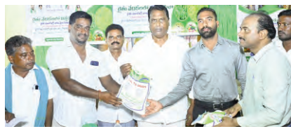
మాత్రమే రైతులు సాగు చేయాలని మంత్రి అడ్లూరి కోరారు. ఈ కార్యక్రమంలో సంబంధిత శాఖ అధికారులు, స్థానిక ప్రజా ప్రతినిధులు, రైతులు, తదితరులు పాల్గొన్నారు.

బడి వచ్చిందని అన్నారు. అధికారులు సమన్వయంతో పనిచేసి రికార్డు స్థాయిలో ధాన్యం, మక్కలు కొనుగోలు చేసినట్లు మంత్రి వివరించారు. కొనుగోలు చేసిన నాలుగు ఐదు రోజుల లోపు డబ్బులను రైతుల ఖాతాల్లో జమ చేసినట్లు మంత్రి తెలిపారు. ధాన్యం కొనుగోలులో కేంద్ర ప్రభుత్వం సహకరించుకున్న రాష్ట్ర ప్రభుత్వం రైతులు పండించిన పంటలను కొనుగోలు చేసినట్లు మంత్రి పేర్కొన్నారు. వానాకాలం సీజన్ లో రైతులు నన్న వడ్ల బోసన్ను అర్హత కలిగిన ప్రభుత్వం సూచించిన ఏడు రకాల విత్తనాలు