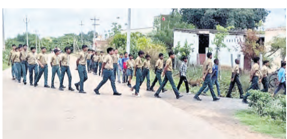
విద్యార్థులకు పొంది ఉన్న ప్రమాదం