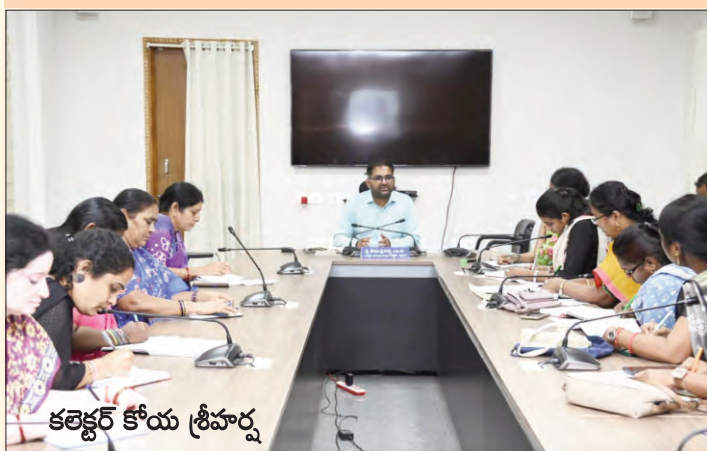
కలెక్టర్ కోయ శ్రీహర్ష

పాలు, కోడిగుడ్లు తదితర పోషకాహారాన్ని నిబంధనల ప్రకారం క్రమం తప్పకుండా అందించాలని తెలిపారు. గర్భిణీ మహిళలు అంగన్వాడీ కేంద్రాలకు వచ్చి అక్కడే భోజనం చేసే విధంగా ప్రత్యేక చర్యలు చేపట్టాలని, వారికి పాలు, కోడిగుడ్లు తదితర పోషకాహారాన్ని నిబంధనల ప్రకారం క్రమం తప్పకుండా అందించి మాతా, శిశు ఆరోగ్యానికి ప్రాధాన్యత ఇవ్వాలని అధికారులను ఆదేశించారు. బాలింతలకు కూడా ప్రభుత్వం అందిస్తున్న పౌష్టికాహారం సకాలంలో అందేలా చర్యవేక్షించాలని సూచించారు. అంగన్వాడీ కేంద్రాల పరిసరాలను ఎల్లప్పుడూ పరిశుభ్రంగా ఉంచాలని, మరుగుదొడ్లు, తాగునీటి సౌకర్యాలు నిరంతరం అందుబాటులో ఉండేలా చూడాలని కలెక్టర్ సూచించారు. చిన్నారులకు నాణ్యమైన ప్రాథమిక విద్యతో పాటు ఆటపాటల ద్వారా అభ్యాసం జరిగేలా అంగన్వాడీ టీచర్లు ప్రత్యేక శ్రద్ధ వహించాలని తెలిపారు. పిల్లలకు అవసరమైన ఆట వస్తువులు అందుబాటులో ఉండేలా చర్యలు తీసుకోవాలని సూచించారు. అంగన్వాడీ కేంద్రాలకు సరఫరా అయ్యే ఆహార పదార్థాలను తప్పనిసరిగా తనిఖీ చేసి నాణ్యతను పరిశీలించాలని అధికారులను ఆదేశించారు. చిన్నారులకు బాలామృతంతో పాటు అందించాల్సిన