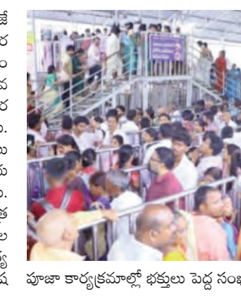
పూజా కార్యక్రమాల్లో భక్తులు పెద్ద సంఖ్యలో పాల్గొని తీర్థప్రసా

ప్రజాపక్షం/ వేములవాడ : వేములవాడలోని శ్రీ రాజరాజేశ్వర స్వామి దేవస్థానం అనుబంధ ఆలయమైన శ్రీ భీమేశ్వర స్వామి క్షేత్రం శుక్రవారం భక్తులతో కిక్కిరిసిపోయింది. వారంతా తమ శుక్రవారానికి తోడు, ప్రభుత్వ సెలవు దినం కూడా కావడంతో ఉమ్మడి జిల్లా నలుమూలల నుంచే కాకుండా ఇతర ప్రాంతాల నుంచి సైతం భక్తులు భారీ సంఖ్యలో తరలివచ్చారు. తెల్లవారుజాము నుంచే భీమేశ్వరాలయానికి చేరుకున్న భక్తులు క్యూలైన్లలో వేచి ఉండి, స్వామివారిని భక్తిశ్రద్ధలతో దర్శించుకుని ప్రత్యేక పూజలు చేస్తూ తమ మొక్కులు చెల్లించుకున్నారు. ఆలయానికి వచ్చిన భక్తులు స్వామివారికి ఎంతో ప్రీతిపాత్రమైన కోడే మొక్కులు సమర్పించుకున్నారు. ఆనంతరం ఆలయంలో నిర్వహించిన రుద్రాభిషేకం, అన్నపూజ, నిత్య కల్యాణం, చండీ హోమం, కుంకుమ పూజ తదితర విశేష