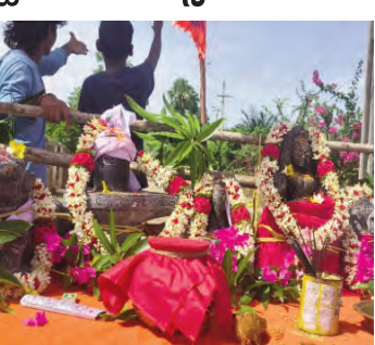
ములకలపల్లి మండలం జగన్నాధపురం పంచాయతీ పరిధిలోని నల్లివారి గూడెం గ్రామంలో వేచేసి ఉన్న ఆంజనేయస్వామి ఆలయం వద్ద నేడు ఉదయం 8గంటలకు సీతారాముల విగ్రహం, శిలలింగం, సుబ్రహ్మణ్య స్వామి విగ్రహాల ప్రతిష్ఠా కార్యక్రమం నిర్వహించనున్నట్లు ఆలయ కమిటీ సభ్యులు తెలిపారు. అనంతరం ఉదయం 11గంటలకు మహా అన్నదాన కార్యక్రమం నిర్వహించనున్నట్లు పేర్కొన్నారు. ములకలపల్లి మండలంలోని భక్తులందరూ అధిక సంఖ్యలో పాల్గొని స్వామివారి ఆశీస్సులు పొందాలని కోరారు.

ప్రజాపక్షం/ములకలపల్లి: ములకలపల్లి మండలం జగన్నాధపురం పంచాయతీ పరిధిలోని నల్లివారి గూడెం గ్రామంలో వేచేసి ఉన్న ఆంజనేయస్వామి ఆలయం వద్ద నేడు ఉదయం 8గంటలకు సీతారాముల విగ్రహం, శిలలింగం, సుబ్రహ్మణ్య స్వామి విగ్రహాల ప్రతిష్ఠా కార్యక్రమం నిర్వహించనున్నట్లు ఆలయ కమిటీ సభ్యులు తెలిపారు. అనంతరం ఉదయం 11గంటలకు మహా అన్నదాన కార్యక్రమం నిర్వహించనున్నట్లు పేర్కొన్నారు. ములకలపల్లి మండలంలోని భక్తులందరూ అధిక సంఖ్యలో పాల్గొని స్వామివారి ఆశీస్సులు పొందాలని కోరారు.