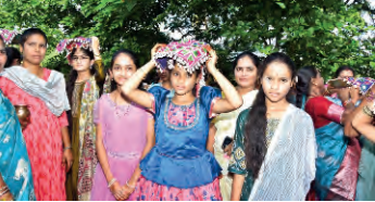
మండల వ్యాప్తంగా సీతా భవాని పండుగను బంజారాలు మంగళవారం ఎంతో భక్తిశ్రద్ధలతో నిర్వహించుకున్నారు. బంజారాలకు అత్యంత పవిత్రమైన, విశిష్టమైన పండుగలలో ఇది ఒకటి. ఈ పండుగను బంజారా ప్రజలు తమ ఇలవేల్పు దేవత అయిన సీతా భవానీ మాతను ఆరాధిస్తూ భక్తిశ్రద్ధలతో జరుపుకున్నారు. తండాలలోని చిన్నలు పెద్దలు అందరూ కలిసి వచ్చి బంజారా సంప్రదాయం ప్రకారం సీతా భవానీ అమ్మవారికి ప్రత్యేక పూజలు నిర్వహించారు. ప్రజలను పశువులు, పంటలకు అంటు వ్యాధులు రాకుండా ఉండాలని ప్రకృతి విపత్తుల నుంచి రక్షించాలని కోరారు. మహిళలు సంప్రదాయ బంజారా వస్త్రాలు, వెండి అభరణాలు ధరించి ప్రత్యేక పూజలు నిర్వహించారు. అమ్మవారికి పసుపు, కుంకుమ, కొబ్బరికాయ, పండ్లు నైవేద్యాలు సమర్పించి భక్తిశ్రద్ధలతో ప్రత్యేక పూజలు చేశారు. కొన్ని ప్రాంతాల్లో సంప్రదాయ ఆచారాల ప్రకారం పశుపూజ కూడా నిర్వహించారు. తండాలో జానపద గీతాలు, నృత్యాలు, సామూహిక వేడుకలతో ఉల్లాసంగా ఉత్సాహంగా గడిపారు.