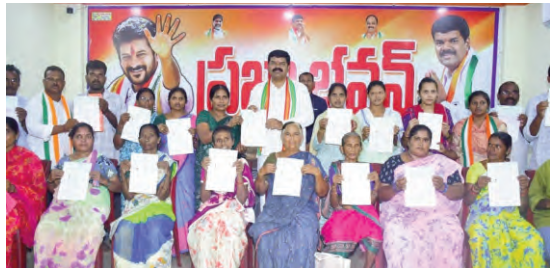
భావిస్తున్నానని పేర్కొన్నారు. ఈ కార్యక్రమంలో మండల అధ్యక్షులు, టౌన్ అధ్యక్షులు, జిల్లా ముఖ్య నాయకులు, సర్పంచులు, ఉపసర్పంచులు, వార్డు సభ్యులు, ముఖ్య నాయకులు, కాంగ్రెస్ పార్టీ నాయకులు, మండల నాయకులు, కార్యకర్తలు, సీఎంఆర్ఎఫ్ లబ్ధిదారులు, వారి కుటుంబ సభ్యులు మరియు అధికారులు పాల్గొన్నారు.