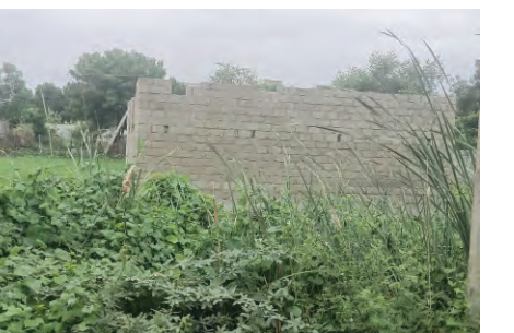
దారులకు సహకరిస్తున్నారంటూ స్థానికులు అనుమానాలు వ్యక్తం చేస్తున్నారు. పట్టణ కేంద్రంలో బీసీ వసతి గృహంతో పాటు పలు అభివృద్ధి పనులకు ఈ స్థలం ఎంతో అనుకూలంగా ఉంటుందని తెలిపారు. అధికారులు ఇప్పటికేనా నిద్రావస్థను వీడి ప్రభుత్వ స్థలాన్ని ఆక్రమించిన వారిపై కఠిన చర్యలు తీసుకోవాలని, ఆక్రమణలు తొలగించి అభివృద్ధి పనులకు ఆ స్థలాన్ని వినియోగించాలని స్థానికులు డిమాండ్ చేస్తున్నారు.

అడ్వకేట్ ముసుగులో కబ్జా చేసినా వెనకడుగు ప్రజాపక్షం / చెన్నూరు: అన్యక్రాంతం అవుతున్న ప్రభుత్వ స్థల ఆక్రమణలను తొలగించాలని ఏకంగా జిల్లా కలెక్టర్ ఆదేశాలు జారీ చేసినా రెవెన్యూ, మున్సిపల్ అధికారులు వెనకడుగు వేస్తుండడంపై చెన్నూరు మున్సిపాలిటీ పరిధిలో తీవ్ర విమర్శలు వ్యక్తమవుతున్నాయి. జూనియర్ అడ్వకేట్ ముసుగులో ఓ ఇంటి నెంబరును ఆధారంగా చేసుకొని పట్టణ శివారులోని నర్సే నెంబర్ 631లో గల కోట్లాది రూపాయల విలువైన ఎకరం స్థల ప్రభుత్వ స్థలాన్ని కబ్జా చేసి అక్రమ నిర్మాణాలు చేపడుతున్నారు. దీనిపై ప్రజాపక్షం దినపత్రికలో ఇటీవలే కథనాలు వెలువడగా స్పందించిన జిల్లా కలెక్టర్ 20 రోజుల క్రితమే చెన్నూరు తహసీల్దార్, మున్సిపల్ కమిషనర్ కు ఆక్రమ నిర్మాణాలను తొలగించి ఆ స్థలాన్ని ప్రభుత్వ అధీనంలోకి తీసుకోవాలని ఆదేశాలు జారీ చేశారు. జిల్లా కలెక్టర్ ఆదేశాలు జారీ చేసి రోజులు గడుస్తున్నా సంబంధిత అధికారులు నిమ్మకు నీరెత్తినట్లు వ్యవహరిస్తూ ఆక్రమణ