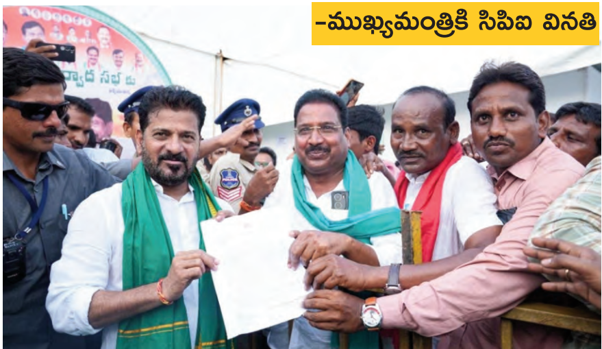
-ముఖ్యమంత్రికి సిపిఐ వినతి

ప్రజాపక్షం/ఖమ్మం : ఉమ్మడి ఖమ్మంజిల్లా సాగు నీటికి సంబంధించి ప్రధాన జీవనాధారంగా ఉన్న సీతారామ ప్రాజెక్టును త్వరితగతిన పూర్తి చేయాలని భారత కమ్యూనిస్టు పార్టీ ఖమ్మం జిల్లా సమితి ఆధ్వర్యంలో ముఖ్యమంత్రి రేపంత్ రెడ్డికి వినతి పత్రం సమర్పించారు. ఖమ్మం జిల్లాలో రెండున్నర లక్షల ఎకరాల నూతన ఆయకట్టుకు సాగునీటిని ఇవ్వడంతో పాటు నాలుగున్నర లక్షల ఎకరాల ఆయకట్టు స్థిరీకరణకు సంబంధించి ప్రారంభించిన సీతారామ ప్రాజెక్టు నిధుల